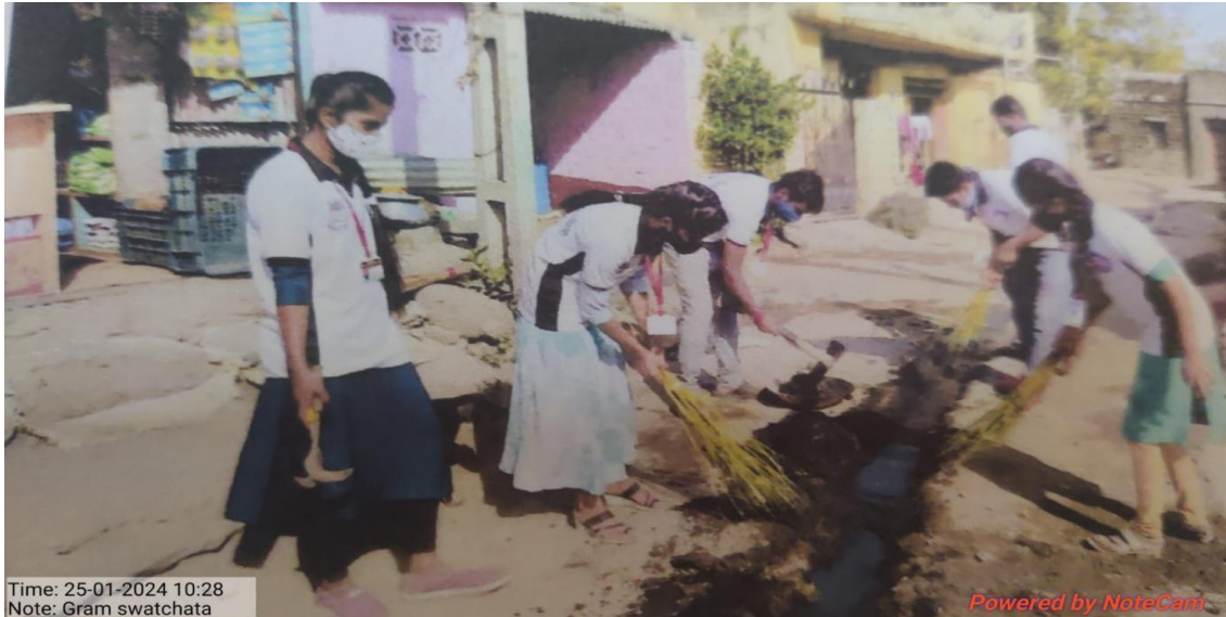
Gram Swachata ( Swatch Bharat Abhiyan )