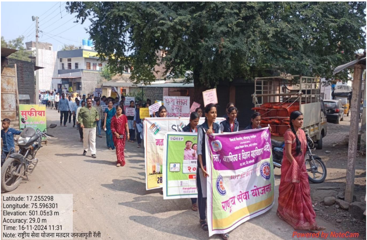
Voters Abhiyan Rally