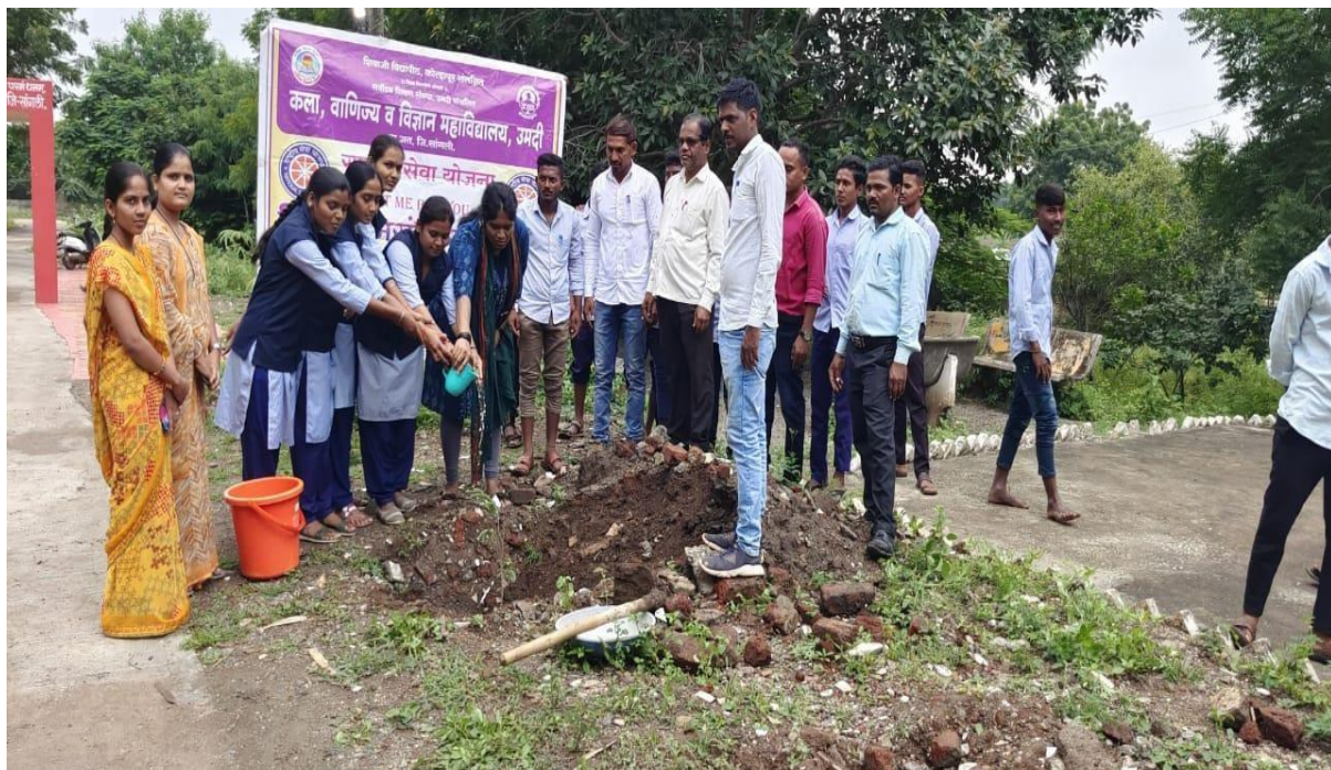
Tree Planation In Government Hospital Umadi